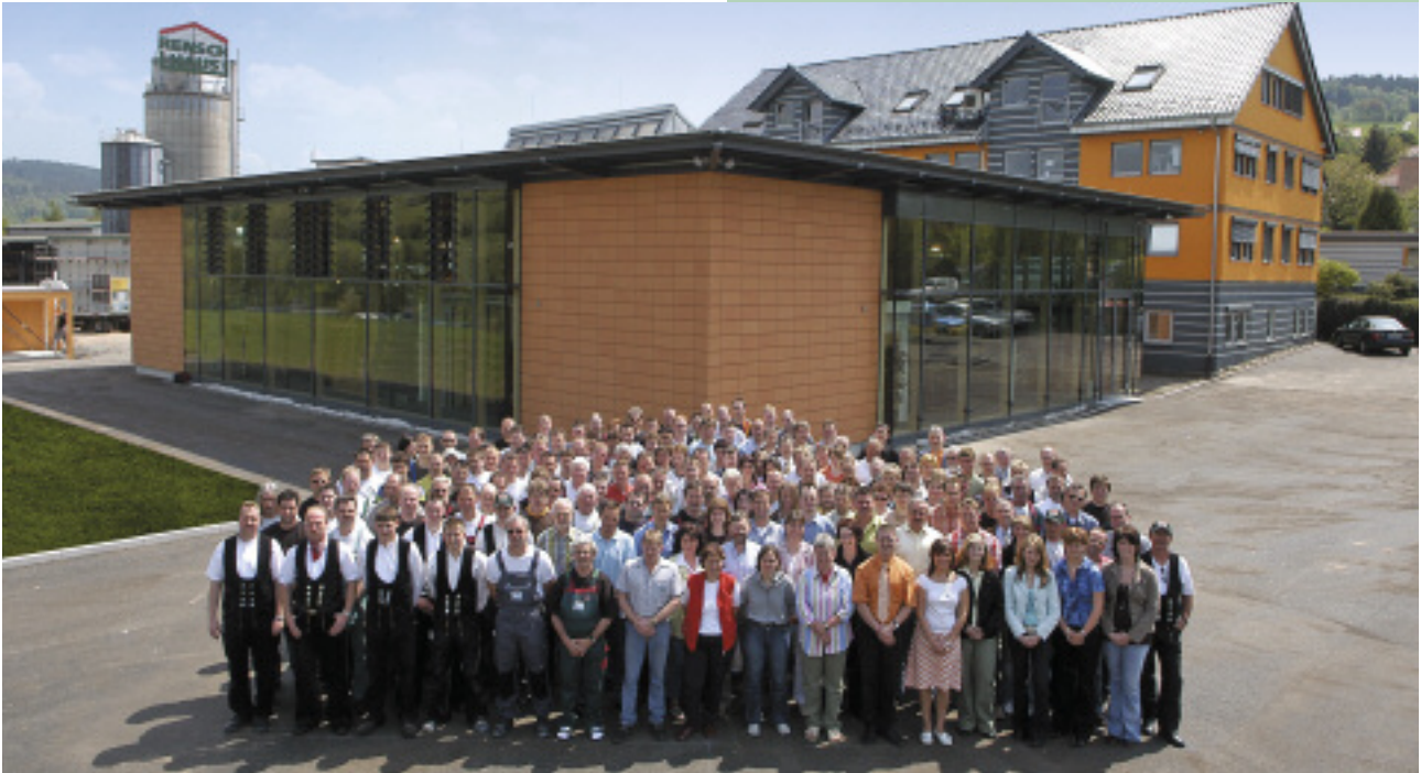
Ideen zum Anfassen: Pünktlich zum 130. Firmenjubiläum eröffnete RENSCH-HAUS im Jahr 2006 ein neues Ausstattungszentrum. In verschiedene Themenbereiche gegliedert, können sich die Besucher auf mehr als 600 m 2 Ausstellungsfläche in Ruhe der Ausgestaltung ihres Traumhauses widmen.

wachs oder das Wohnen im Alter. Flexibilität heißt das Zauberwort! So entstehen individuelle Wohnwelten, die ein komfortables und gesundes Leben bzw. Erleben ermöglichen.