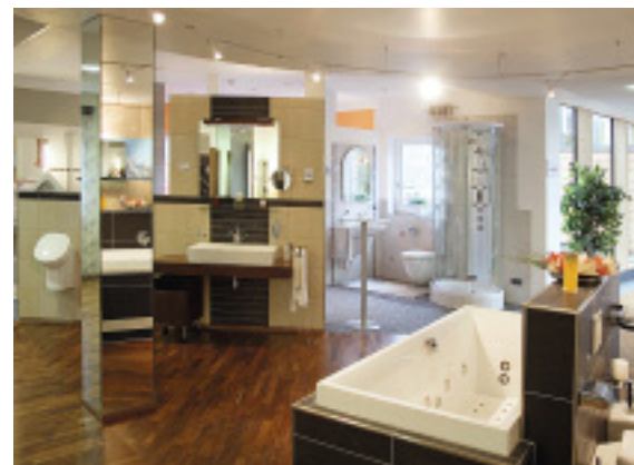
Ob exklusive Badewanne, bodengleiche Dusche oder stilvolle Armaturen – das Ausstattungszentrum bietet Inspirationen für jeden Geschmack und Geldbeutel.