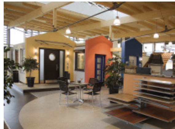
Die Bauherren profitieren von der breiten Palette an Markenprodukten und können ihrem Haus unter kompetenter Beratung Schritt für Schritt das gewünschte Antlitz verleihen.